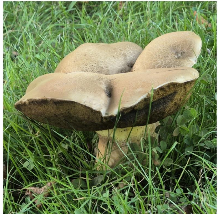
Motiv: Pilze an der Leiblachhalle